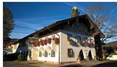
Denkmalgeschütztes Rathaus Errichtet 1930 / 31

Der Name Wiessee geht zurück auf die erstmalige Nennung des Ortes Wesses um 1017 im Urbar des Klosters Tegernsee und bedeutet, dass es sich um eine Siedlung westlich des Sees handelt.